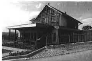
Rogaška Slatina - Guest House Eco Vila Mila