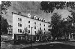
Rogaška Slatina - Hotel Zagreb - Health & Beauty