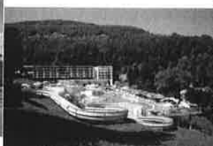
Topolšica - Terme Topolsica - Hotel Vesna